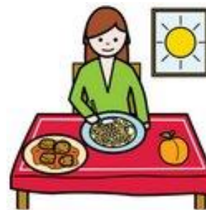
+ JÍDLO, DOMÁCNOST