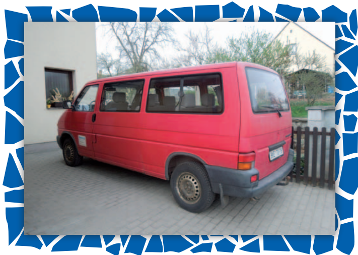
Na první pohled je vidět, že v Letovicích potřebují vyměnit auto za něco novějšího.

V Letovicích takové auto potřebujeme. Ne, že bychom neměli žádné, což o to, jedno máme. Naše dodávka k přepravě osob s tělesným postižením je již „plnoletá“. Příští rok bude mít 20 let. S ohledem na bezpečnost a další urgentní opravy tohoto vozu, je jedinou možnou cestou pořízení jiného auta. Jen tak můžeme zajistit, aby se klienti dopravili, kam potřebují? Mělo by to být auto pro 8 či 9 lidí, s bezbariérovou úpravou. A nemusí být ani úplně nové, stačí zánovní, hlavně, aby dobře fungovalo. Oslovujeme firmy i nadace, píšeme žádosti, sháníme kontakty, pořádáme veřejnou sbírku i aukci uměleckých děl. Prostě normální poctivý fundraising. Věříme, že se nám podaří auto pořídit, doufáme, že to bude do konce tohoto roku.